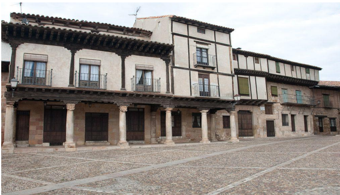
PLAZA DEL TRIGO ATIENZA, UNA DE LAS PLAZAS MÁS BELLAS