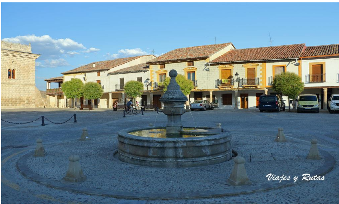
PLAZA MAYOR COGOLLUDO